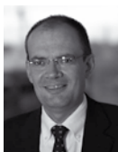
Prof. Dr. Ralf Imhof Rechtsanwälte Schulz Noack Bärwinkel