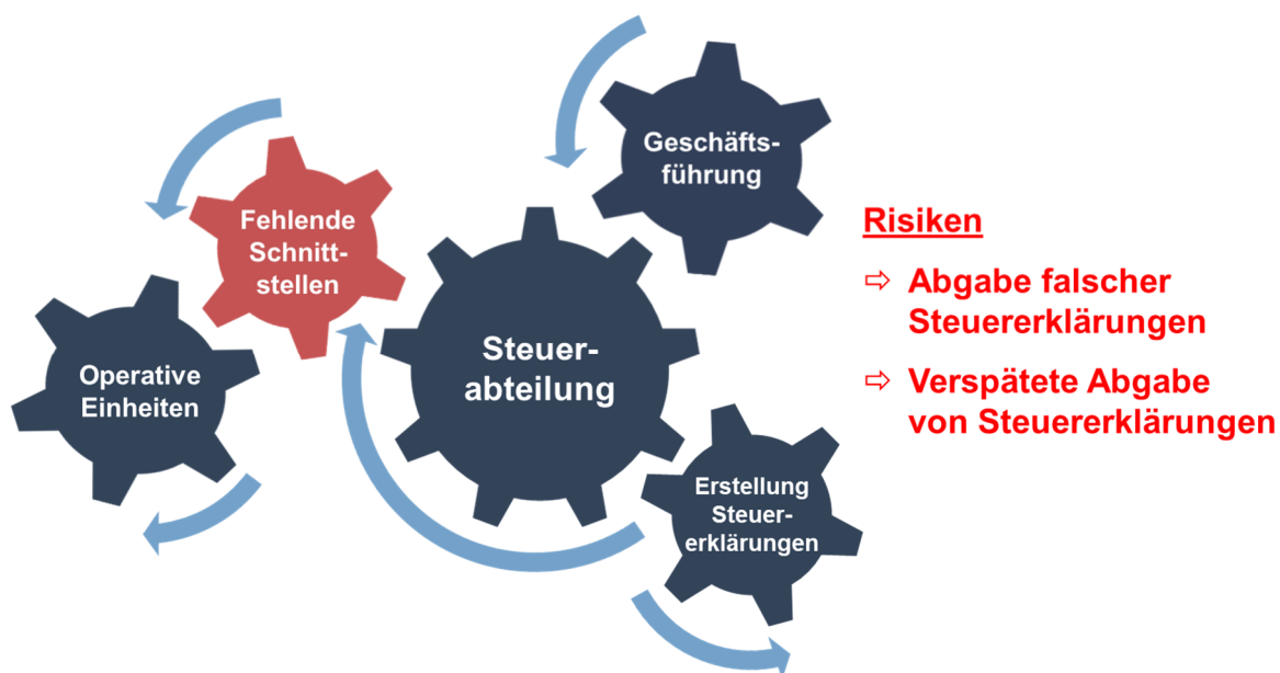
Abbildung 1: Entstehung steuerlicher Risiken

Fehlerhafte Steuererklärungen sind nachträglich durch den Steuerpflichtigen zu berichtigen. Dabei wird die korrigierte Steuererklärung entweder als einfache Berichtigung i.S.v. § 153 AO ( gutgläubiger Fehler ) oder als Selbstanzeige i.S.v. § 371 AO ( leichtfertiger oder vorsätzli-